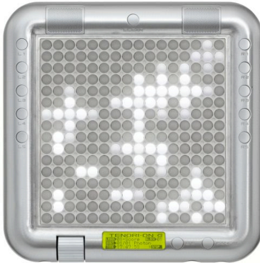
Abbildung 4: Das Tenori-On (TNR-W)