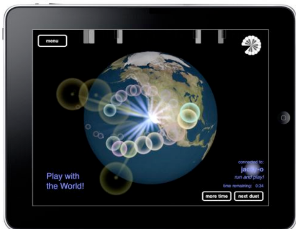
Abbildung 3: Der duet mode der Magic-Piano-App für das iPad, ©Smule

„It's the first instrument we know of in history that allows it's players to hear one another from around the world. And so far our users have listened to each other in over 40 million performances.“ 25