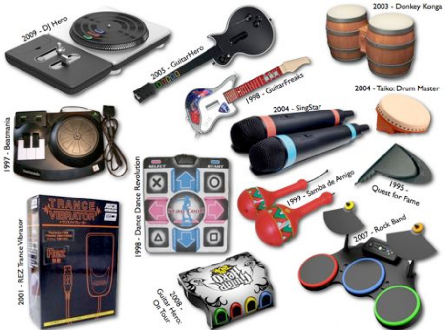
Abbildung 1: Beispiele für Controller bzw. Zusatzhardware für Rhythmus-Reaktionsspiele